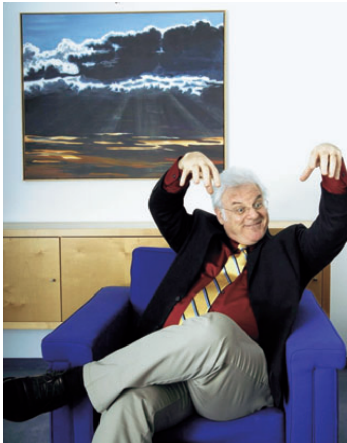
Physiker Laughlin: „Der Student explodiert“